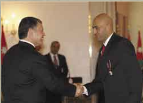
• جلالة الملك عبدالله الثاني يكرم البطل مصطفى سلامة بوسام ملكي.

قطع مصطفى سلامة المسافة على الأقدام بين القطب الشمالي والقطب الجنوبي وهي رحلة تحتاج قرابة (٦) أشهر من المشي المتواصل وتحتاج كلفه مالية عالية تصل حدود نصف مليون دولار .. كاشفاً أنه يأمل أن يكون بذلك الشخص الرابع عشر عبر التاريخ الذي يعتلي القمم السبع (العالمية المعروفة) وقطع المسافة بين القطبين المتجمدين الشمالي والجنوبي.