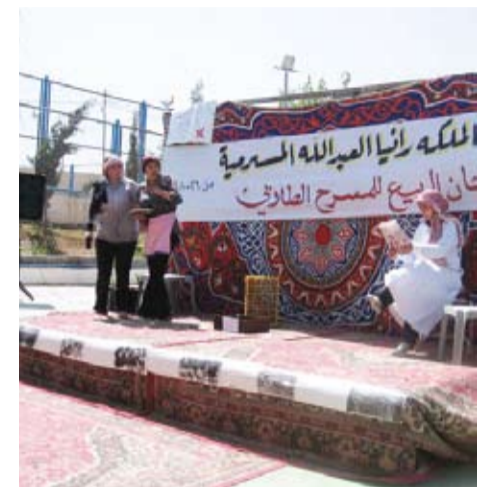
Group Performance Award.

"Discovering the Trick"—Bayt El-Maqdes School/Private Education Directorate—Best Costume Award, and the School shared Best Script Award with 2nd Educational Directorate Suwaisah Secondary School's play "Environmental Pollution", which also won Best