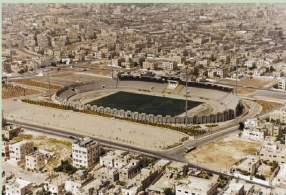
King Abdullah Sports City