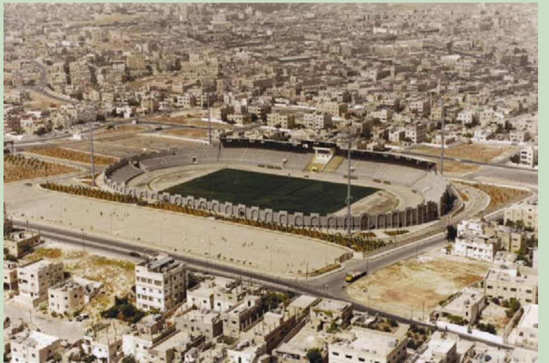
مدينة الملك عبدالله الرياضية