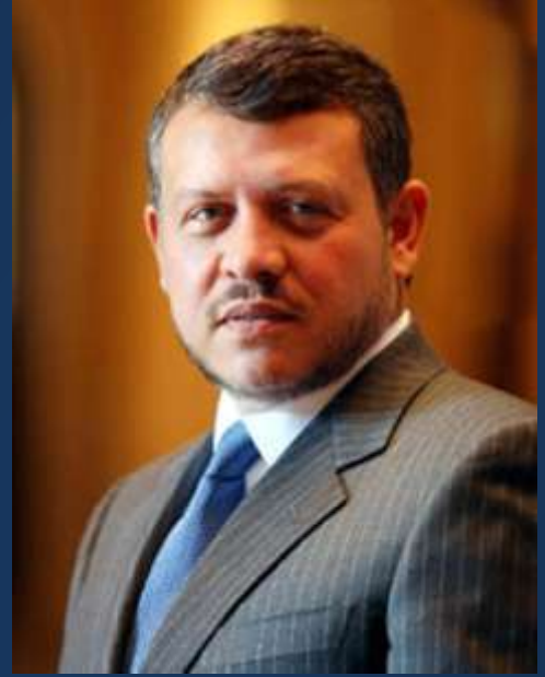
جلالة الملك عبد الله الثاني بن الحسين

" فنحن نريد حكومة تعمل بثقة وشفافية وبروح الفريق لخدمة الصالح العام، من دون تراخ أو تباطؤ تحت وطأة الخوف من اتخاذ القرار أو حسابات الشعبوية الآتية، أو سياسات الاسترضاء التي أضاعت على وطننا في الماضي الكثير من فرص التميز والتطور والتغيير الايجابي الذي يمكننا من مواكبة روح العصر ومتطلباته ».