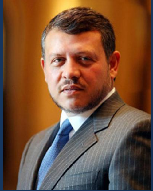
جلالة الملك عبد الله الثاني بن الحسين

" «فنحن نريد حكومة تعمل بثقة وشفافية وبروح الفريق لخدمة الصالح العام، من دون تراخ أو تباطؤ تحت وطأة الخوف من اتخاذ القرار أو حسابات الشعبية الآنية، أو سياسات الاسترضاء التي أضاعت على وطننا في الماضي الكثير من فرص التميز والتطور والتغيير الايجابي الذي يمكننا من مواكبة روح العصر ومتطلباته.»